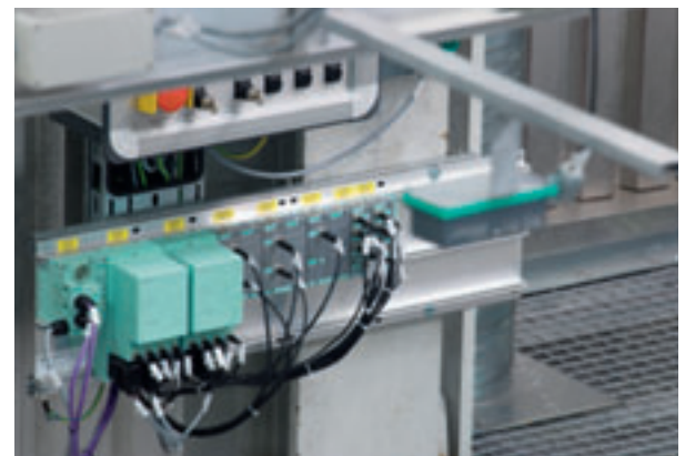
Simatic ET 200pro mit Powermodulen erlaubt den dezentralen und flexiblen Aufbau von Automatisierungslösungen

Aufgrund ihrer Ausführung in Schutzart IP65 haben die Automatisierungskomponenten von Siemens für die dezentrale Steuerung der Anlage einen großen Vorteil: Sie besitzen die erforderliche hohe Flexibilität für einen kostengünstigen Ausbau des Automati-